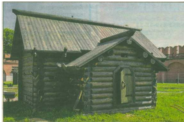
Прежде, чтобы войти в дом, надо было перешагнуть через высокий порог.

роваться на этнографические постройки центра России, а за аналоги взять крестьянские срубы-избы.