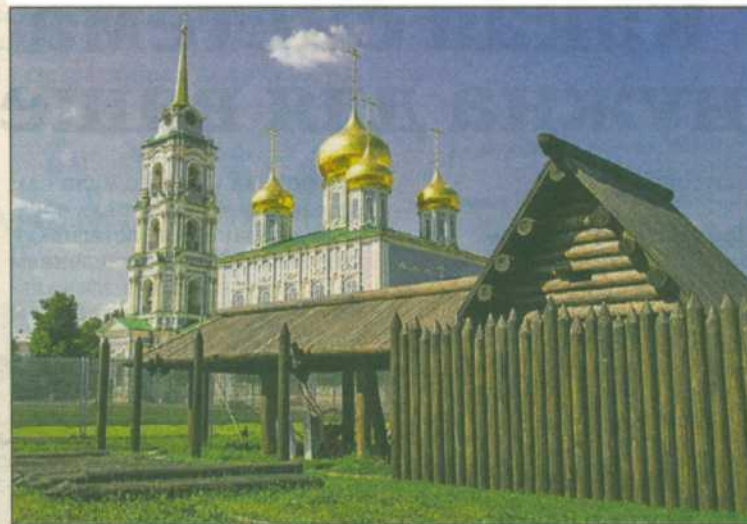
Каждый участок в старину ограждался надежной стеной.