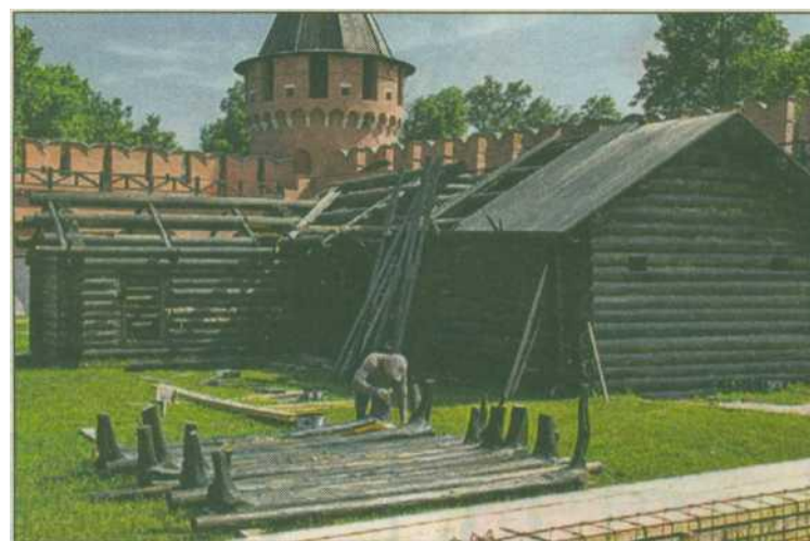
Средневековые избы делаются по традиционным русским технологиям.