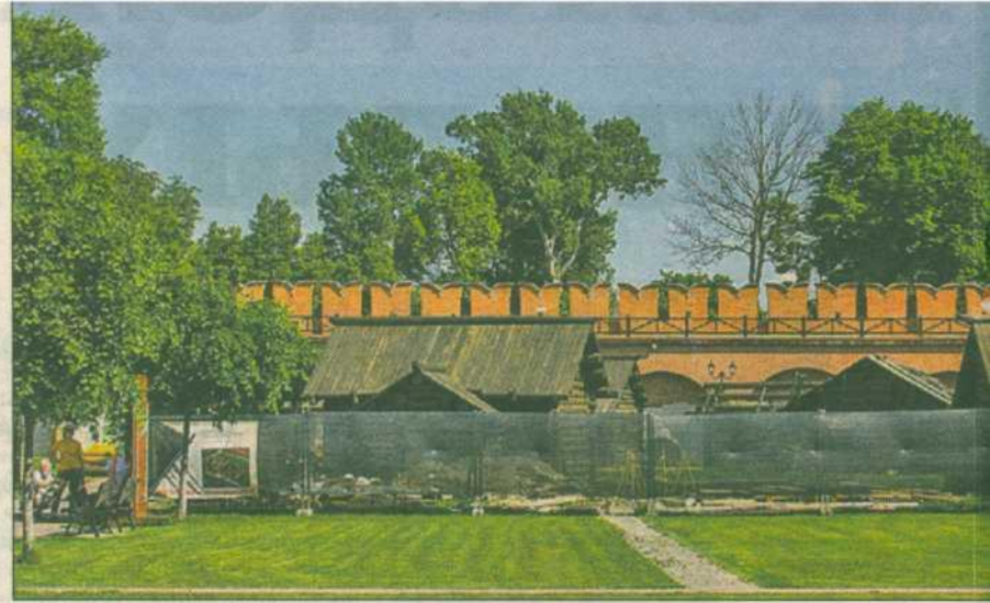
Осадные дворы возводятся справа от центрального входа в кремль.