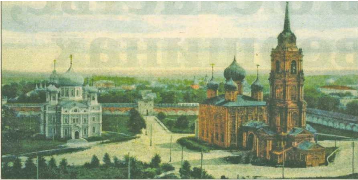
Новые застройки не закроют панорамного вида на главные достопримечательности кремля.